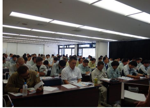
労働災害の発生状況や事例の他、労働災害防止の具体的な取組み内容（墜落・転落防止、熱中症対策、伐木作業時の安全対策規制の改正など）についてご講演頂きました。