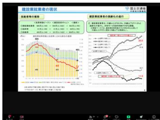
ライブ配信の様子