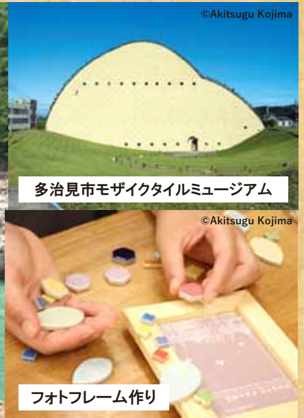
多治見市モザイクタイルミュージアム