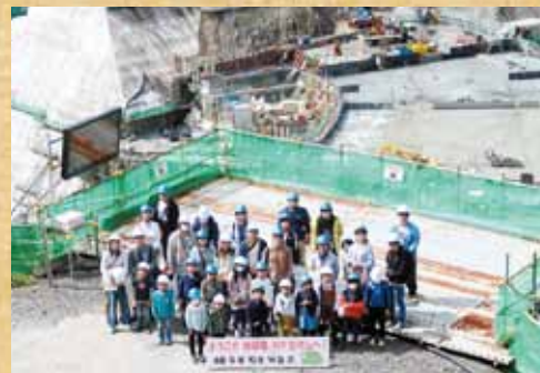
↑ 2023年度のツアーの様子です。