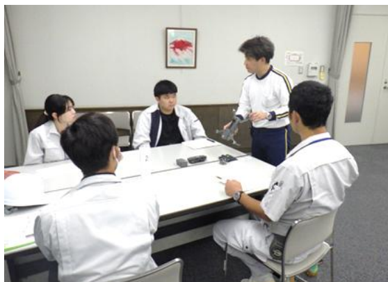
講義の様子（基本操作説明）