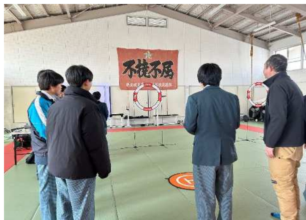
【ICT技術体験】「ドローン操作体験」 コントローラーで小型ドローンの操縦を行い、ドローン操作の体験をしました。