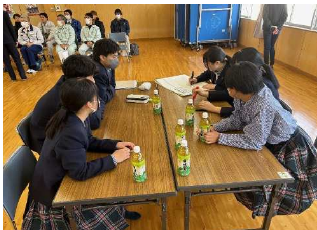
【交流サロン①】生徒たちが事前に整理した建設業のイメージや疑問を模造紙にまとめました。