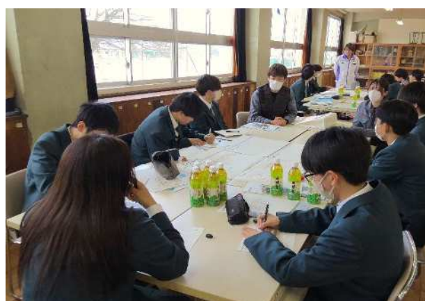
【交流サロン③】座談会を経て、建設業のイメージや疑問がどのように変化したかを整理しました。