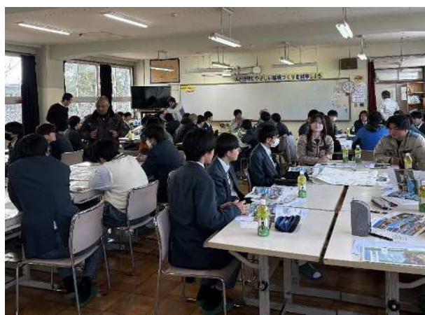
【交流サロン②】模造紙の内容に沿って、ご自身の経験や感じたことを踏まえ、地元で働くやりがいなど分かりやすくお話いただきました。