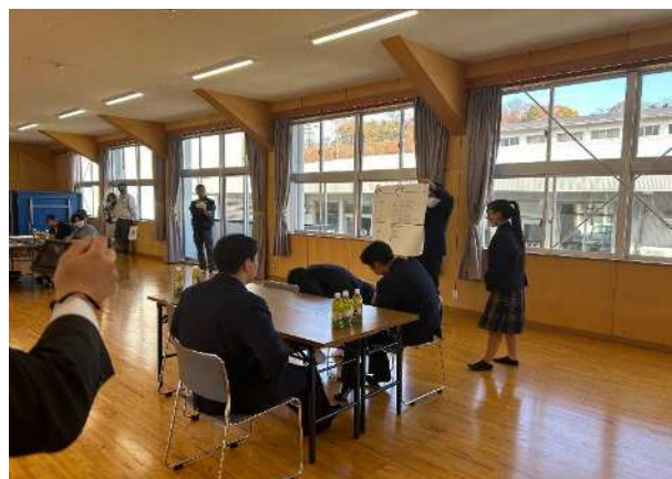
【交流サロン④】各班、代表者1名が整理した内容を発表しました。