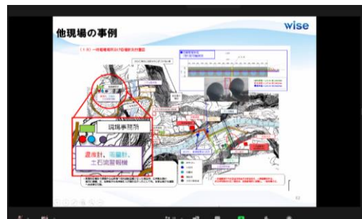
評価点が高かった具体事例を学びました。