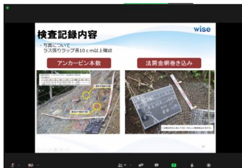
竣工検査で受けた指摘を整理・共有し、他の現場で同じ指摘を受けないようにすることについて学びました。