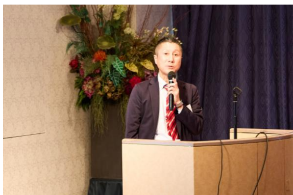
（公財）岐阜県建設研究センター（松井氏）