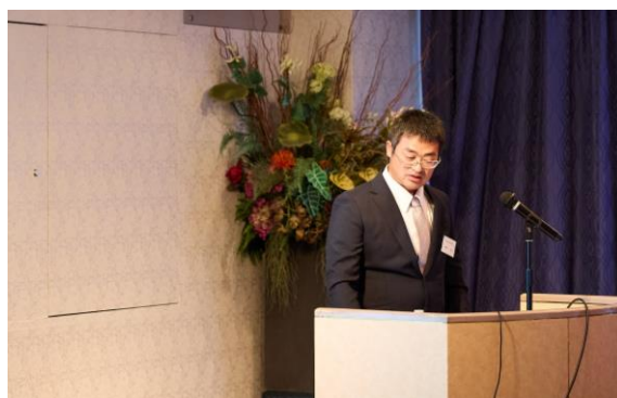
（一社）岐阜県特殊工事技術協会